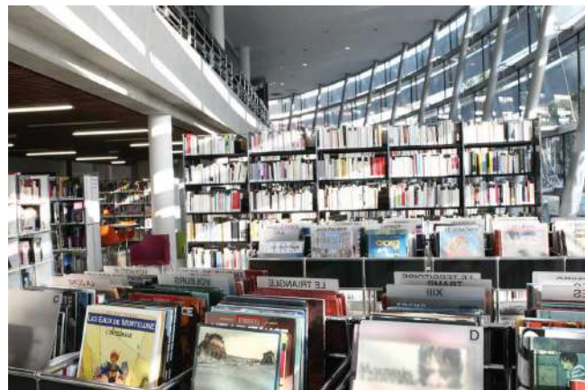
Médiathèque Boris Vian de Chevilly-Larue

Au sein des collectivités, le portage des projets est en général confié à la bibliothèque. Les bibliothèques territoriales et les associations de développement de la lecture sont les principaux bénéficiaires des contrats territoire-lecture.