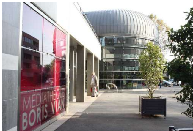
Médiathèque Boris Vian de Chevilly-Larue

Les contrats territoire-lecture sont pluriannuels. Leur durée optimale est de 3 ou 4 ans. L'étape de réalisation de l'état des lieux et d'élaboration du programme peut être, ou non, incluse dans le déroulement de la convention.